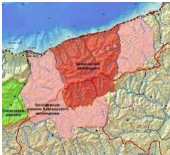
Байкальский государственный заповедник

Даны три карты заповедников Бурятии и разрезанные рисунки с эмблемами этих заповедников, надо собрать рисунок и выявить к какому заповеднику относится это рисунок